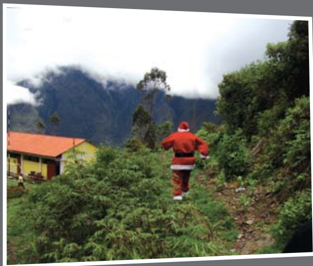
¡Se escapa Papá Noel!